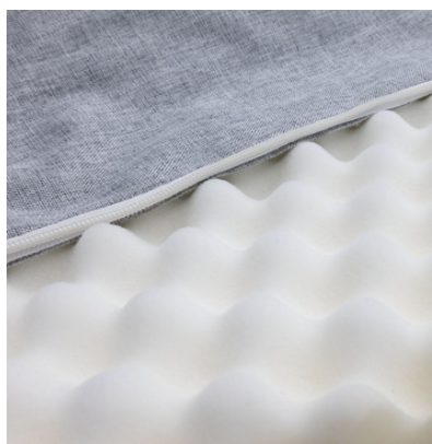
Materac wodoodporny w pokrowcu paroprzepuszczalnym