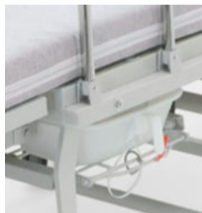
Elektrycznie chowany/wysuwany basen z uchwytem