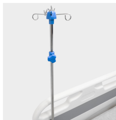
Stojak na kroplówkę