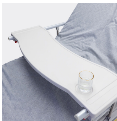
Stolik nakładany na barierki typu tablet