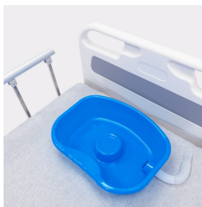
Praktyczna umywalka do mycia głowy